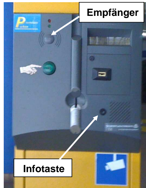
Ein- und Ausfahrtsgerät in den übrigen Stellplatzobjekten mit Premiumkarten-Funktion (außer H 6 und Lortzingblock)

Zur Kontrolle des Guthabens oder zum Aufladen der Premium-Karte, schieben Sie diese bitte in den vorgesehenen Schacht am Kassenautomaten (Bild unten). Auf dem Display (Bild 3) wird das aktuelle Guthaben angezeigt. Aufladbar ist die Premium-Karte in 5,- € - Schritten. Drücken Sie dazu so oft die rote Taste neben der Anzeige „5,- €“ bis der von Ihnen gewünschte Aufladebetrag angezeigt wird. Drücken Sie nun die rote Taste neben der Anzeige „Bezahlen“ und begleichen Sie den Betrag unter Verwendung von Münzen und/oder Banknoten. Danach entnehmen Sie bitte Ihre Premium-Karte und benutzen diese wie gewohnt. Sollte der Aufladebetrag versehentlich zu hoch gewählt sein, drücken Sie bitte die rote Taste neben der Anzeige „Abbruch“. Danach starten Sie den Vorgang wie oben beschrieben erneut.